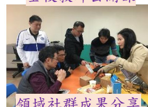
領域社群成果分享