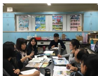
教師與劉淑雯教授 共備科普課程教案