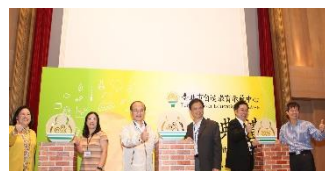
105 年成立日新自造 教育與科技中心