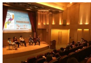
全校共讀《學習就像終身幼兒園》，形塑共同教育理念